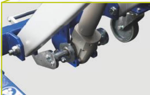
Massive, geschweißte Hydraulik- und Scherenlagerung